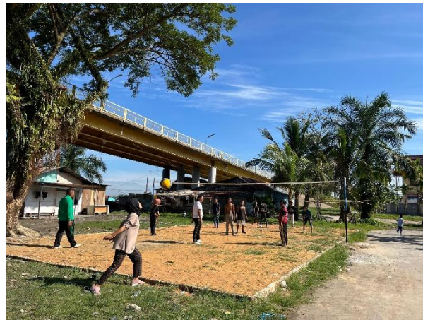
Gambar 4. Pertandingan percobaan setelah perbaikan lapangan.

Hasil dokumentasi menunjukkan bahwa kegiatan ini dilakukan dengan semangat gotong royong yang tinggi. Perbaikan tersebut tidak hanya memperbaiki kondisi fisik lapangan, tetapi juga menumbuhkan rasa kepemilikan masyarakat terhadap sarana publik. Setelah perbaikan, dilakukan serangkaian kegiatan berupa pelatihan dasar teknik voli bagi anak-anak dan remaja, serta penyelenggaraan turnamen antar-RT. Turnamen ini diikuti dengan antusias oleh berbagai kelompok usia, sehingga tidak hanya meningkatkan keterampilan olahraga, tetapi juga mempererat interaksi sosial antarwarga. Kehadiran penjual makanan dan minuman kecil saat turnamen juga menjadi indikator munculnya peluang ekonomi baru di sekitar lapangan.