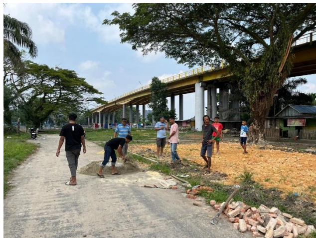
Gambar 3. Pengerjaan penyemenan tepi lapangan dan pemasangan batas lapangan.