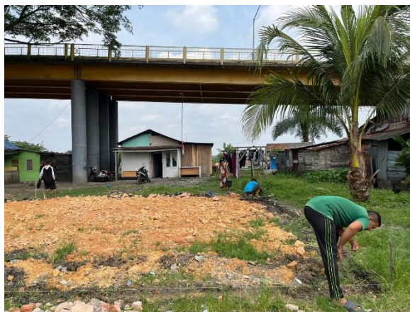
Gambar 2. Proses pembersihan area lapangan dari rumput liar dan sampah.