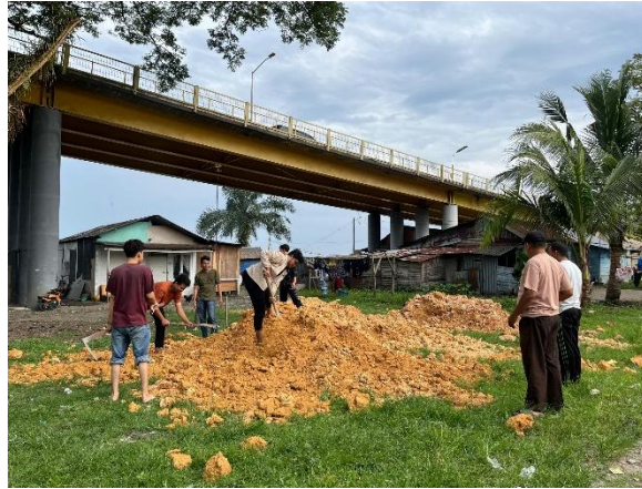
Gambar 1. Proses gotong royong masyarakat dan mahasiswa dalam perataan tanah lapangan voli.