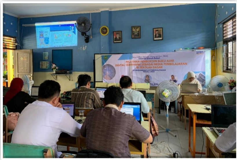
Gambar 3. Penyampaian Materi Pembuatan Buku

Praktek pembuatan bahan ajar digital dimulai dengan praktek perwakilan peserta maju ke depan mendemostrasikan langsung tombol-tombol yang perlu di klik untuk menghasilkan bahan ajar yang menarik. Peserta juga diminta untuk menambahkan unsur video maupun gambar bergerak ke media ajar yang dibuat agar terasa lebih menarik bagi siswa. Beberapa video peserta diambil dari lama youtube yang kemudian ditampilkan Alamat sumber pada buku ajar yang dibuat.