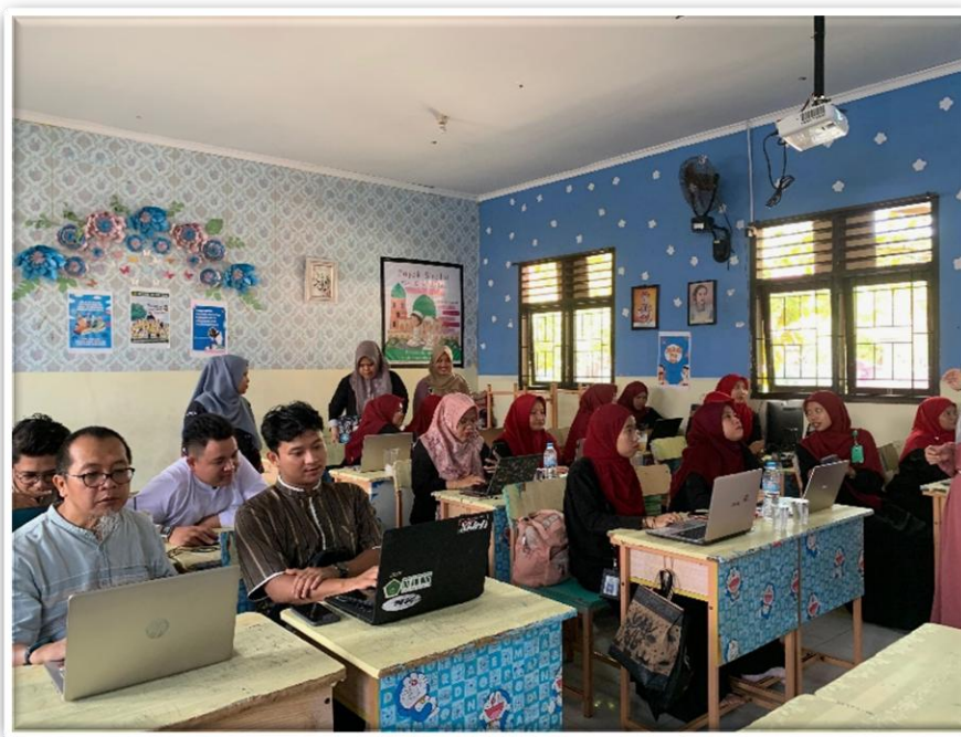
Gambar 2. Kegiatan Praktek Pembuatan Buku Ajar Digital

Kegiatan pelatihan pembuatan buku ajar dilaksanakan pada hari jumat, tanggal 18 Oktober 2024. Kegiatan dilaksanakan dengan peserta berjumlah 23 orang guru. Kegiatan diikuti oleh guru kelas maupun guru mata Pelajaran dari SD Muhammadiyah Pangkalpinang. Kegiatan pelatihan dimulai dengan sambutan wakil kepala sekolah sekaligus membuka kegiatan yang segera dilanjutkan dengan penyampaian materi oleh tim pengabdian. Penyampaian materi langsung diiringi dengan praktek langsung pembuatan buku ajar digital oleh tim beserta seluruh peserta. Kegiatan pelatihan dapat dilihat pada gambar 2.