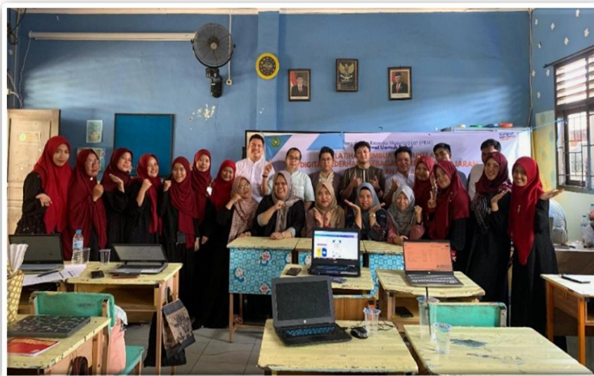
Gambar 5. Foto Bersama Peserta Pelatihan

Setelah semua buku ajar diselesaikan, empat orang peserta terpilih diberikan doorprise berupa bingkisan spesial yang telah disiapkan tim pengabdian. Hal ini menjadi tambahan semangat peserta yang telah menyelesaikan buku ajar digitalnya lebih cepat dan paling bagus. Kegiatan pelatihannya kemudian ditutup dengan pembagian bingkisan dan snack sore kepada peserta serta penutupan oleh wakil kepala sekolah. Wakil kepala sekolah juga menyampaikan kepuasan atas kegiatan tersebut dan sangat mengapresiasi usaha para peserta guru dalam membuat buku ajar digitalnya masing-masing hingga terselesaikan dengan sangat baik dan bagus. Kegiatan ini juga ditutup dengan foto bersama seluruh peserta pelatihan yang ditampilkan pada gambar 5.