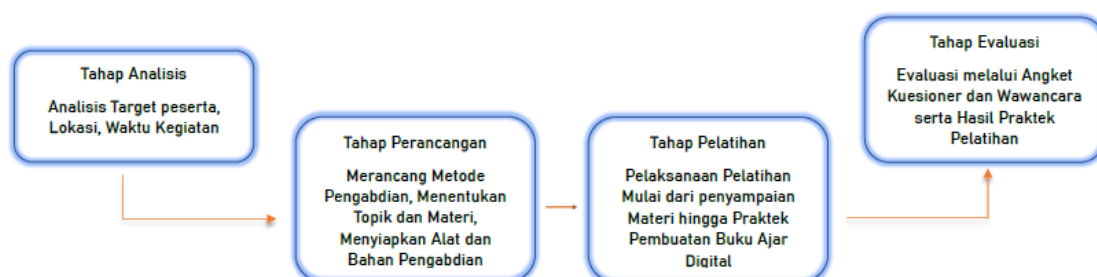
Gambar 1. Tahapan Kegiatan Pengabdian

Pelaksanaan kegiatan pengabdian kepada masyarakat ini dibagi menjadi beberapa tahap atau prosedur kerja yakni tahapan analisis, tahapan perancangan, tahapan pelatihan dan tahapan evaluasi. Pada tahapan analisis, tim menganalisis sekolah yang menjadi target kegiatan dengan melakukan observasi di SD Muhammadiyah Pangkalpinang. Pada tahapan perencanaan, tim bersama mitra menentukan materi kegiatan dan waktu serta tempat pelaksanaan kegiatan pengabdian. Pada tahapan pelatihan barulah dilaksanakan kegiatan pelatihan dengan target capaian adalah peserta memiliki buku ajar digital sendiri minimal untuk satu kali pertemuan pembelajaran di kelas. Tahapan terakhir yakni evaluasi, dimana seluruh peserta diminta mengisi angket kuesioner kegiatan yang dari hasil tersebut kemudian dianalisis tingkat ketercapaian kegiatan dan keberhasilan dari pelatihan yang diberikan. Langkah kegiatan pelatihan disajikan pada gambar 1.