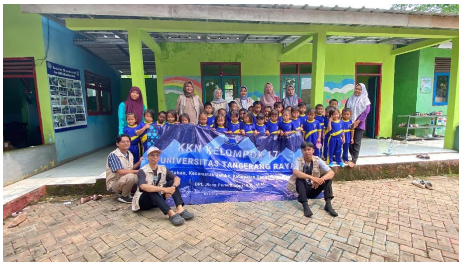
Gambar 2 : Foto bersama murid dan wali murid SD Alhusna

Peserta pengabdian ini didominasi oleh ibu rumah tangga berusia 40-49 tahun yaitu sbenyak 16 orang disusul ibu rumah tangga dengan usia 30-39 tahun sebanyak 15 orang. Hasil analisis pretest menunjukkan bahwa tingkat pemahaman peserta terhadap pencatatan keuangan masih sangat rendah, dengan rata-rata nilai sebesar 30/100 dan hanya 20% peserta yang sudah memiliki kesadaran akan pentingnya pencatatan keuangan keluarga. Temuan ini menegaskan pentingnya intervensi edukatif yang sistematis dan terarah untuk meningkatkan literasi finansial di kalangan ibu rumah tangga.