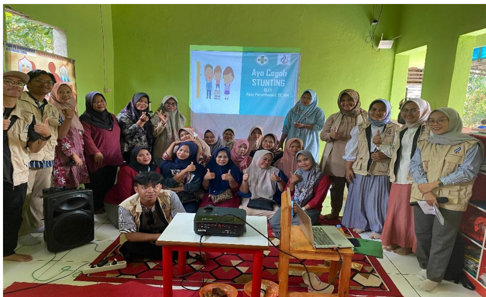
Gambar 3 : Foto bersama sebagian peserta

Selain peningkatan skor tes, observasi lapangan juga menunjukkan adanya perubahan sikap peserta selama kegiatan berlangsung. Pada awal sesi, peserta cenderung pasif dan ragu-ragu dalam mengemukakan pendapat atau bertanya. Setelah sesi diskusi interaktif dan praktik, partisipasi aktif peserta meningkat, terlihat dari banyaknya pertanyaan yang diajukan serta keseriusan dalam mengisi format pencatatan keuangan.