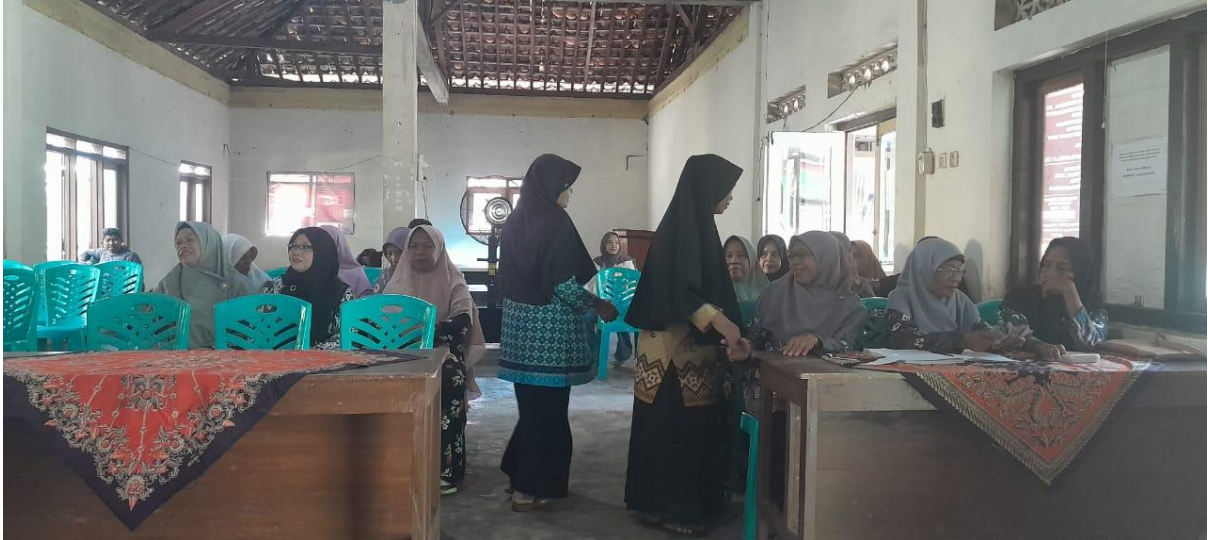
Gambar 1. Ibu-ibu PKK Desa Kradenan sedang mengikuti sosialisasi dan edukasi UU KDRT

Sebelum sosialisasi, hasil pre-test menunjukkan bahwa sekitar 65% peserta belum memahami substansi Undang-Undang Nomor 23 Tahun 2004 tentang Penghapusan Kekerasan dalam Rumah Tangga (UU KDRT). Instrumen pengukuran berupa kuesioner pengetahuan hukum dengan skala 1–5 yang disusun berdasarkan indikator pemahaman (bentuk-bentuk KDRT, hak korban, mekanisme pelaporan, dan perlindungan hukum). Setelah sesi edukasi, hasil post-test menunjukkan peningkatan signifikan: 85% peserta mampu menyebutkan bentuk-bentuk KDRT, jalur pelaporan, serta lembaga perlindungan terkait.