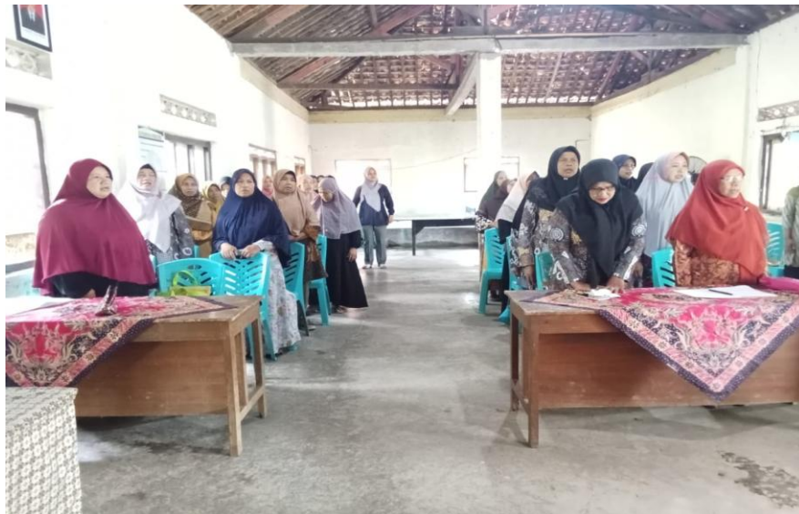
Gambar 5. Ibu-ibu PKK Desa Kradenan sepakat membentuk Forum Warga Peduli Keluarga Aman

Kader PKK tidak hanya berperan sebagai peserta, tetapi juga sebagai agen edukasi. Mereka dilatih untuk menyampaikan kembali materi terkait UU KDRT kepada keluarga dan lingkungan sekitar melalui pertemuan rutin PKK maupun forum masyarakat desa. Dengan demikian, manfaat kegiatan ini dapat menyebar lebih luas dan berkelanjutan.